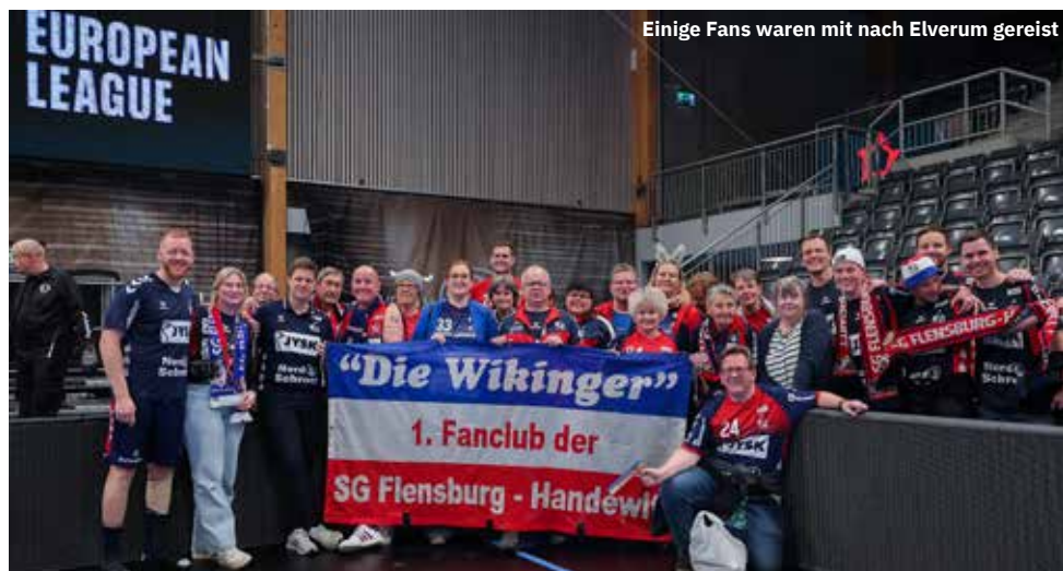
Einige Fans waren mit nach Elverum gereist

Es ist der zweite Akt gegen den norwegischen Vize-Meister. Vor Wochenfrist behauptete sich die SG Flensburg-Handewitt hauchdünn mit 33:32 in Elverum. Ein zweiter Sieg wäre wichtig. Angesichts der bisher gezeigten Leistungen ist ein Weiterkommen für Elverum keineswegs ausgeschlossen. Deshalb gibt es für die SG nur ein Ziel: einen Sieg. Sie möchte nicht nur die Gruppe E der EHF European League gewinnen, sondern auch 4:0 Punkte mitnehmen.