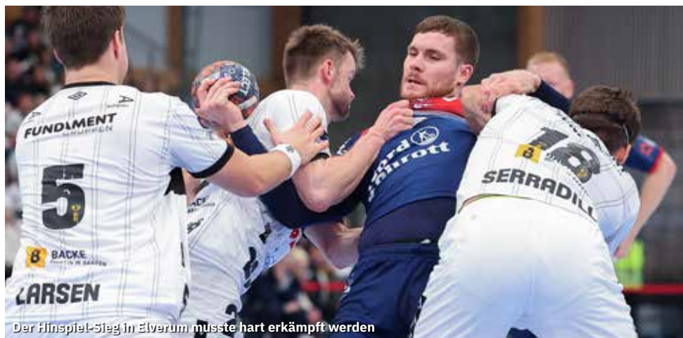
Der Hinspiel-Sieg in Elverum musste hart erkämpft werden

Abdruck nur mit Genehmigung des Herausgebers