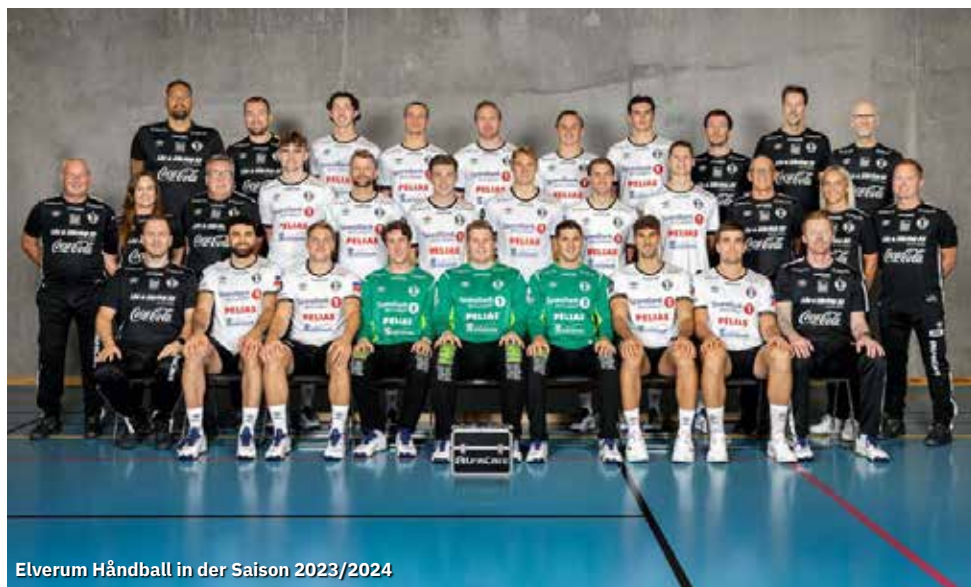
Elverum Håndball in der Saison 2023/2024