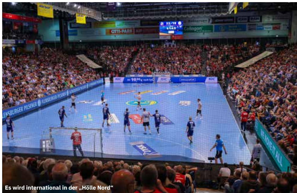
Es wird international in der „Hölle Nord“