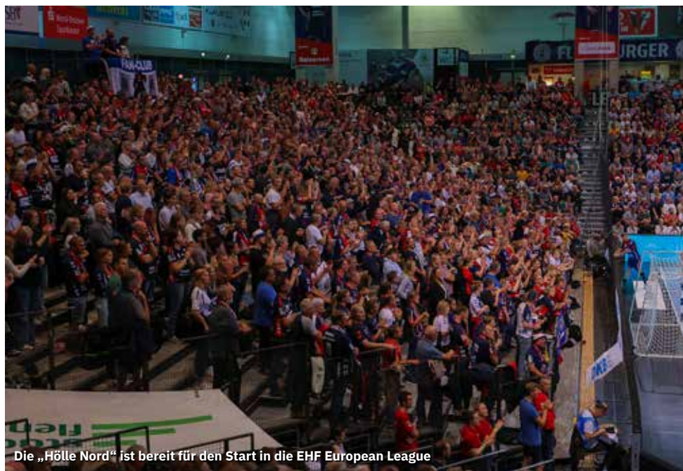
Die „Hölle Nord“ ist bereit für den Start in die EHF European League

Abdruck nur mit Genehmigung des Herausgebers