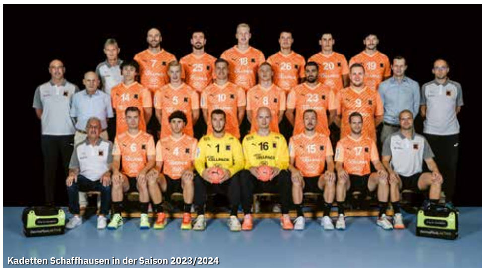
Kadetten Schaffhausen in der Saison 2023/2024